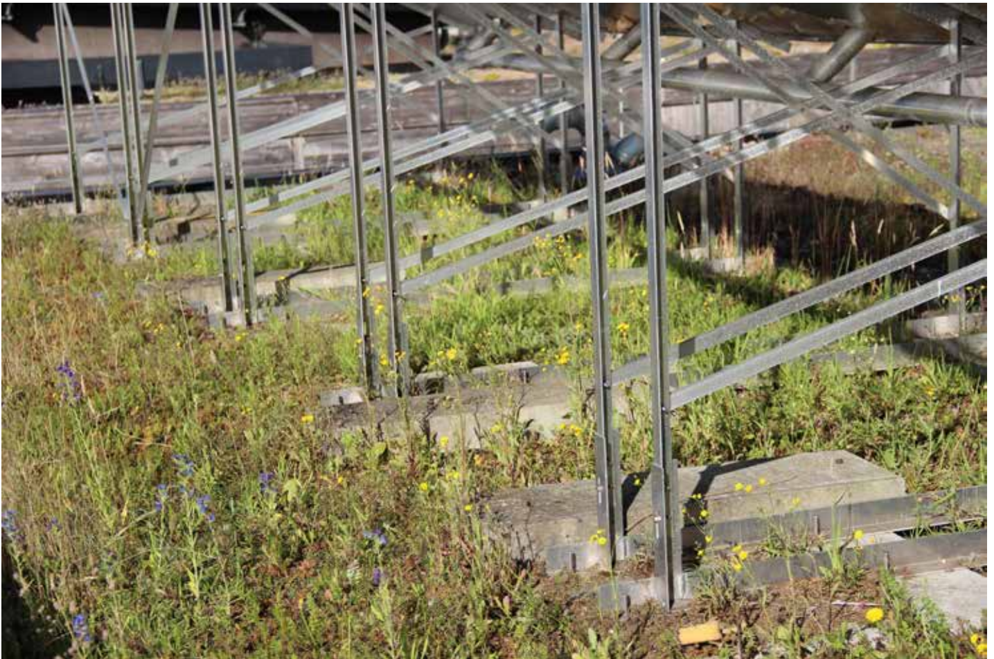
Foto 2. Kruidenrijke begroeiing op het dak met zonnecollectoren. Foto: Petra van den Berg, juni 2019.

van beide daken ligt een kiezelstrook. Op het zonnecollectordak liggen ook kiezelstroken aan de voorkanten van de rijen zonnecollectoren (foto 1). In de loop der jaren is het onderhoud op beide daken minimaal geweest. Houtige planten worden enkele malen per jaar handmatig verwijderd en één keer per jaar (na 15 oktober) worden de daken gemaaid en het maaisel afgevoerd.