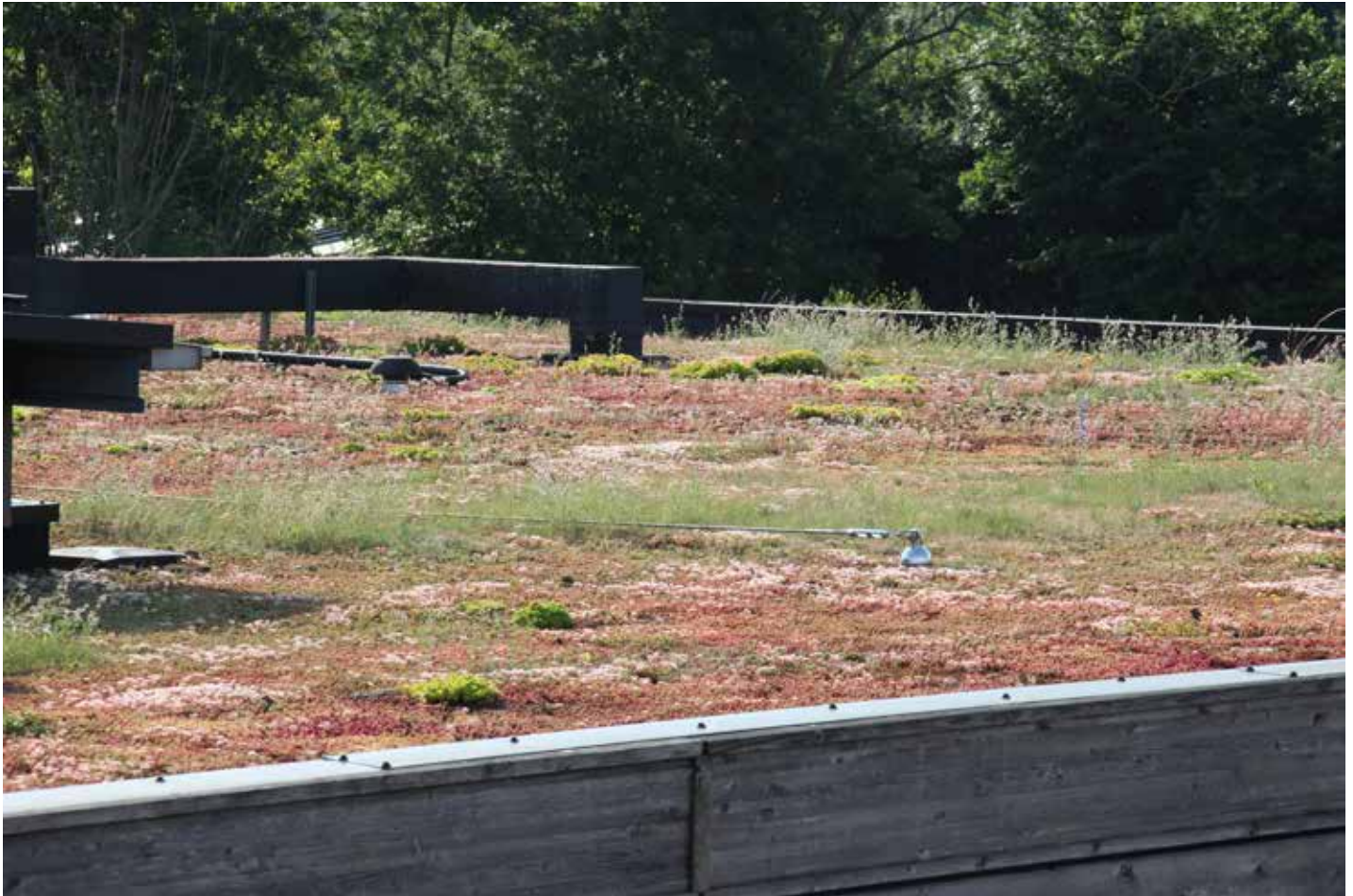
Foto 3. De begroeiing op het dak zonder zonnecollectoren wordt gedomineerd door Sedum. Foto: Petra van den Berg, juni 2019.

tegenover gemiddeld vijf soorten per plot op het dak zonder zonnecollectoren (fig. 1). De totale bedekking was niet significant verschillend tussen de daken (fig. 1). Wel hadden de plots op het zonnecollectordak een significant hogere bedekking van kruiden, houtige planten en mossen, maar